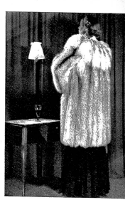
Der Pelzmantel zum Abendkleid ist ein seltenes Geschenk, das bestimmt Freude bereiten wird

ZU UNSERM WETTBEWERB. Mit dieser Nummer bringen wir die letzten Geschenkanregungen, und wir möchten nun allen raten, an die Zusammenstellung der Lösung zu gehen. Noch erscheinen Inserate in den nächsten Nummern, welche die richtige Lösung erwarten lassen, doch kann schon jetzt die Herkunft mancher Artikel mit Sicherheit festgestellt werden. In einer der nächsten Nummern werden wir eine spezielle Seite für die Eintragung der richtigen Resultate reservieren und bitten deshalb unsere Abonnenten, mit der Einsendung bis zu diesem Zeitpunkt zu warten. Vergesse aber die Schatzung des Gesamtwertes aller gezeigten Gegenstände nicht, damit ihr wenn möglich einen grösseren Preis erhaltet!