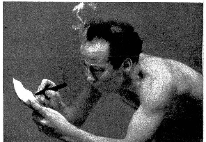
Der von den englischen „Miles“-Flugzeugwerken entwickelte „ewige“ Füllhalter der RAF, der auf einem ganz neuartigen Prinzip beruht, ist nun auch in der Schweiz erhältlich. Nicht nur kann man mindestens ein Jahr lang mit dem Dauerfüllhalter schreiben, bevor die Füllung zu Ende geht, sondern es kommt auch kein Einfrieren der Füllung in Frage. Das Geschriebene trocknet unmittelbar, so dass man selbst unter Wasser — und entsprechend also bei jedem Hadelwetter — damit schreiben kann, ohne dass die Schrift verwischt (ATP)