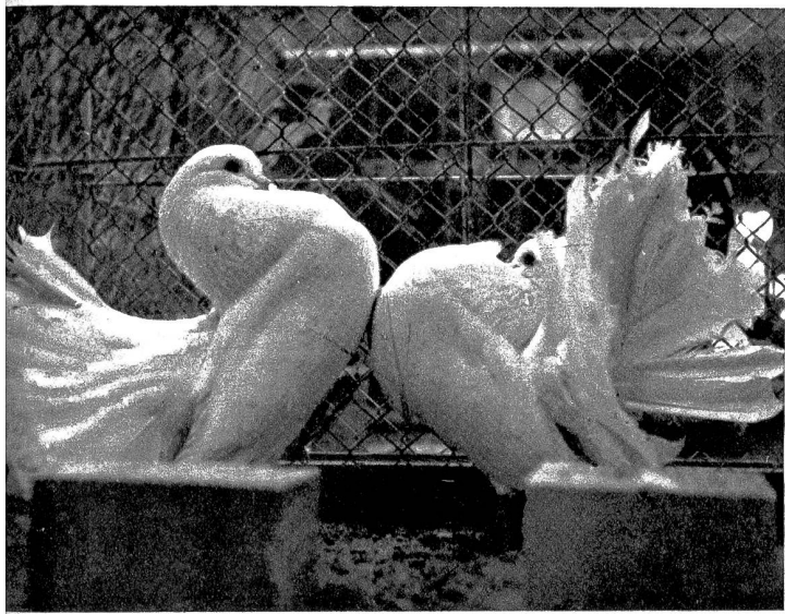
Links: In der zur Zeit in Vevey stattfindenden Nationalen Taubenzuchtausstellung nehmen die gurrenden Vögel das Interesse der Öffentlichkeit in Beschlag. Unser Bild zeigt ein Pärchen von Pfautauben (Züchter: Otto Schweizer, Bern), die mit 92 Punkten bewertet wurden