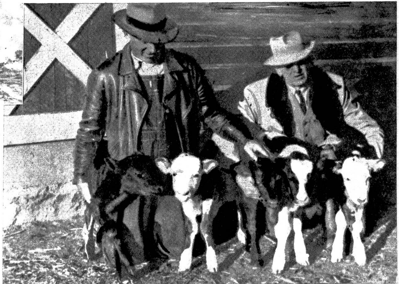
Das Glück im Kuhstall lächelte einem Farmer in Fairbury (Nebraska), als er ein Muttertier fünf gesunde Kälblein zur Welt brachte. Bald hatte der Farmer nichts weiteres zu tun, wie seinen Stall tagtäglich gegen Zahlung eines Eintrittsgeldes den neugierigen Besuchern zu öffnen