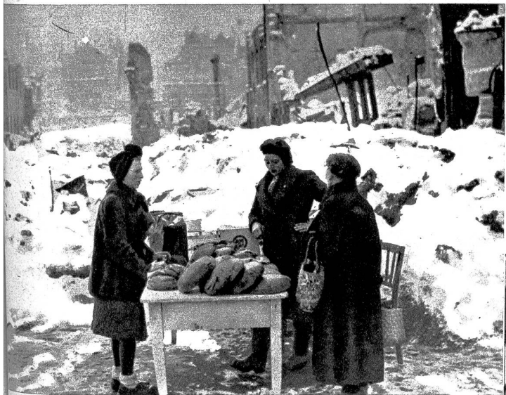
Die zerstörte Stadt der Parteitage, Nürnberg, ist für einige Zeit Mittelpunkt der Welt geworden, weil der Kriegsverbrecherprozess ein Stück Weltgeschichte rekonstruiert. Die Stadt selbst, weitgehend in Ruinen verwandelt, hat ihr Bild wenig verändert und die Bevölkerung zeigt sich auffallend interessiert. Begreiflich, denn die Nahrungssorgen gehen vor. Eine Bäuerin hat trotz der Kälte ihren Brotladen auf offener Strasse errichtet und braucht um die Kunden nicht zu bangen