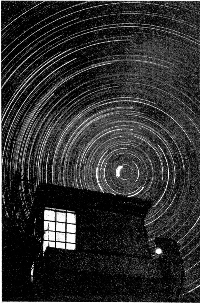
Irdische und himmlische Lichter, in der Heiligen Nacht (Der Gang der Sterne während einer Nacht)

lieber Maître, aber —“ sie wird flüchtig rot — „es gibt doch Dinge, die man sich in Gegenwart eines Dritten —“