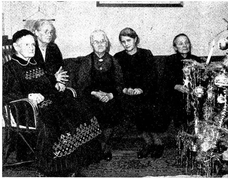
Das 100. Weihnachtsfest. Welcher Kontrast zu den Bildern unserer Reportage vom 1. Weihnachtsfest! Welch eine Zeitspanne liegt zwischen beiden Themen! Ein Jahrhundert trennt sie!