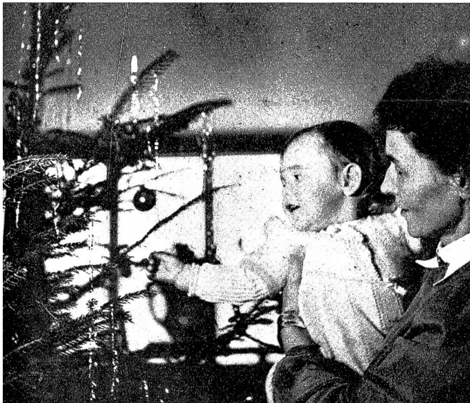
Jede Kugel, jedes Lichtlein, alles ist noch unglaubliches, geheimnisvolles Ereignis