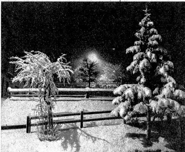
Durchs verschneite Dorf schreitet die Nacht

„Beruhigen Sie sich, Madame“, sagt er mit aufrichtiger Wärme, „dieser Irrtum wird sich ja aufklären lassen. Viel-