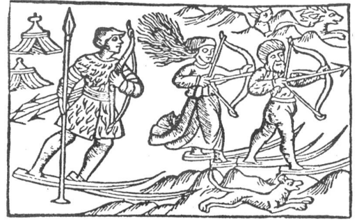
Jagende skifahrende Finnen im 16. Jahrhundert, nach einem zeitgenössischen Holzschnitt (aus Claus Magnus 1555)