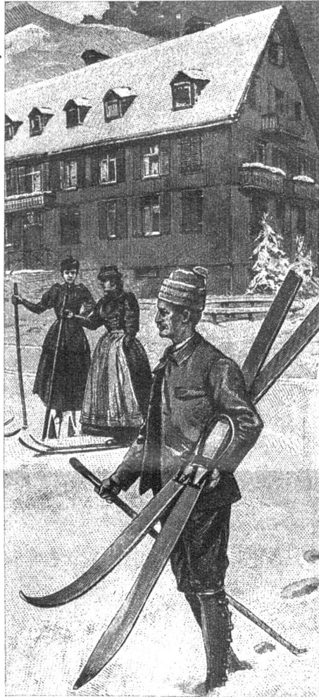
Skifahrer im Jahre 1895

Bis dahin war ja der Winter für Sportfreunde eine Zeit der Entsagung. Schwimmen, Rudern verhinderte die Eisdecke auf Flüssen und Seen, Tennis und Fussball konnte bei Schnee und kalten Temperaturen auch nicht betrieben werden und der einzige Ersatz bot das Schlittschuhlaufen, freilich war hierzu nicht überall Gelegenheit, und zudem ist man bei diesem Sport an eine beschränkte Fahrbahn gebunden, während vielen Sportfreunden gerade das schrankenlose Umhertummeln