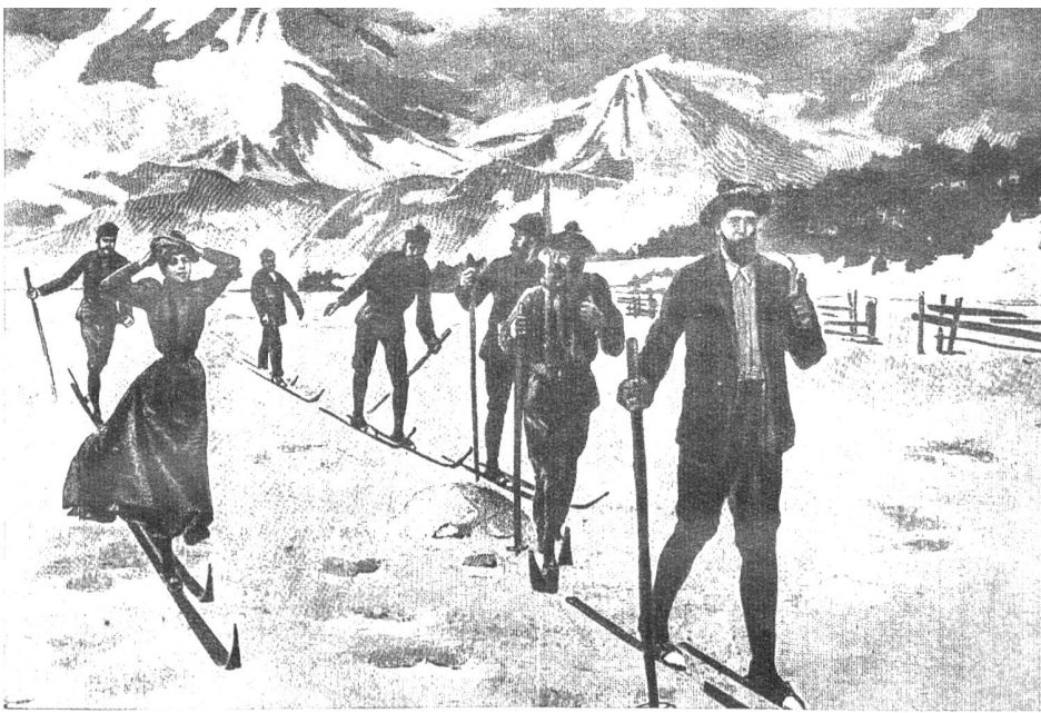
Skifahrer um 1890