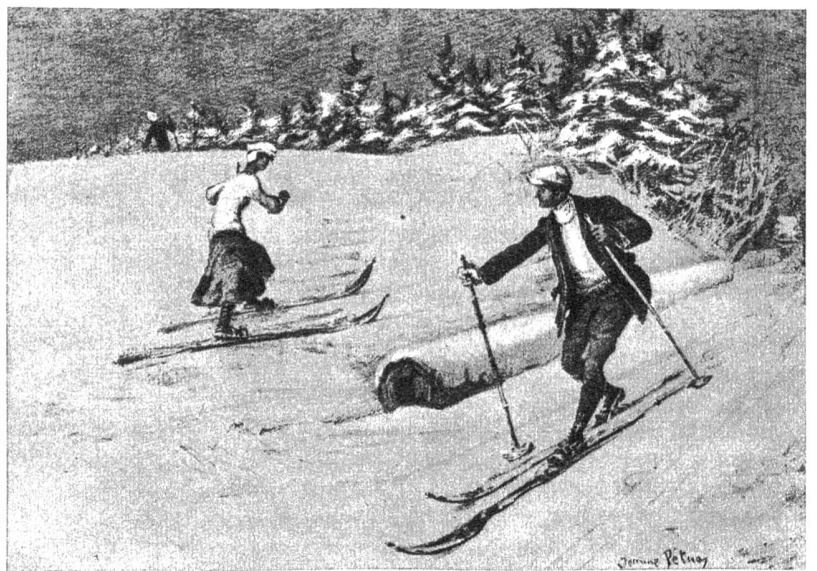
Skifahrer im Jahre 1907. Lithographie von Jeanne Pétua