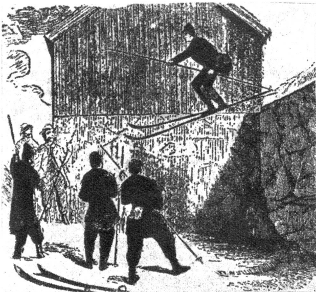
Erstes Bild eines Schanzensprunges von einer 2,7 m hohen Steinmauer am 16. Februar 1862 in Grefsen

den grössten Genuss bietet. Schneeschuhe in verschiedenen Formen gab es zwar bei allen nordischen, vor allem den skandinavischen Völkern, seit Jahrhunderten, ihre Form wird jedoch breiter je mehr man nach Osten, also Asien und von dort nach Amerika vordringt. So sind die Schneeschuhe der nordsibirischen Völker rundliche, mit Fellen überzogene Weidengeflechte (etwa wie ein Tennisracket, aber ohne Stiel), während die nordamerikanischen Indianer kreisförmige Holzplatten benützten, um sich auf grossen Schneeflächen bewegen zu können. In Europa waren es die Lappen, die zuerst Schneeschuhe schufen, die einigermaßen unsern Skis ähnlich sind. Schon im 6. Jahrhundert nach Chr. berichtete ein griechischer Schriftsteller namens Prokop über solche Schneeschuhe, er war es, der davon sprach, dass die nordischen Völker die nomadischen Laben Skrifinnen nannten. Skrid bedeutet soviel wie Gleiten, auch wird berichtet, dass im Jahre 710 der byzantinische Kaiser Leo mit 50 Begleitern mit Schneeschuhen den Kaukasus überquerte. Offenbar aber wurden diese Anregungen zu wenig bekannt und von den wenigen, die Lesen und Schreiben konnten, nicht angewendet oder weiterpropagiert. Erst Nansens Grönlandexpedition propagierte die Skis in grossem Umfange, erregte doch sein Buch «Mit