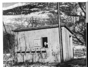
... dabeliegenden Garten machen zu können. «Die Leute zählen er —, «lachten mich anfänglich aus. Aber ich bewies die Richtigkeit meines Mittels. Eine Kartoffelstauden in geschützter Lage, die nicht vereist war, erfor, während andere Stauden in ungünstiger Lage, die vereist waren, erhalten blieben