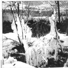
Die Eisbildung an den Bäumen ist eine Notwendigkeit, zumal man durch sie die 80 Kalorien Wärme (pro Kilo Eis) oder, wie der Physiker sagt, die sogenannte latente Schmelzwärme erreicht