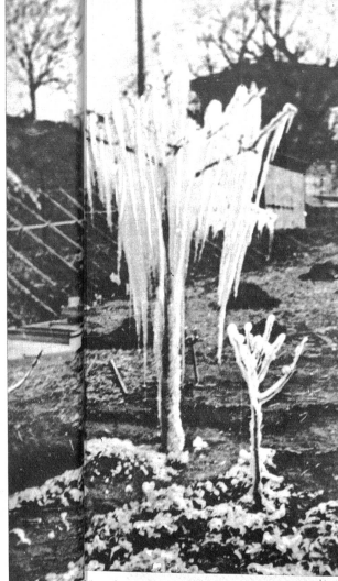
Bäume während der Vereisung aus

das Wasser ab. Die Bäume, stundenlang unter Eis gehend viel besser, als die andern, die nicht geliehen bei eben erfroren. Hexerei? Keineswegs, sondern nur die Anwendung des physikalischen Gesetzes, denn nur durch von gefrierendem Wasser sich dauernd um Null Grad zu halten. Mit dem Uebergang des Wassers vom flüssigen in den festen Zustand wird eine grosse Wärmemenge in Form des Temperaturschwundes unter Null frei, die zum dem Grund müssen die Bäume dauernd Grad dient. Sie haben dann keine tiefere Temperatur zu ertragen, unbekümmert darum, ob das Thermometer zeigt, dass die Pflanzen, die 0 Grad ertragen, sind vor Frost geschützt. Solange sie in der schützenden Eisschicht vor Frost geschützt Prof. Cattien, die in weitem Umkreis Beachtung