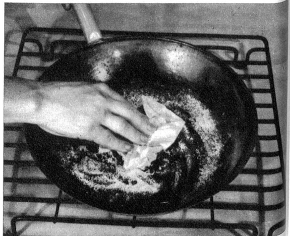
Mühelos werden Bratenpfannen mit Salz und Seidenpapier ausgerieben. Sie bleiben so lange gut erhalten