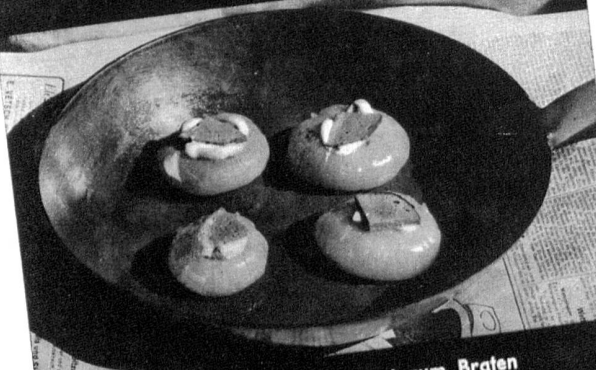
Die Zwiebeln, vorbereitet zum Braten