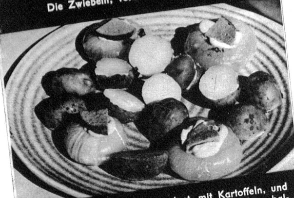
Die Zwiebeln hübsch angeordnet mit Kartoffeln, und zwar wurden die Kartoffeln nur gut gewaschen, halbiert und ohne Fett, auf dem Kuchenblech im Ofen weich gebacken