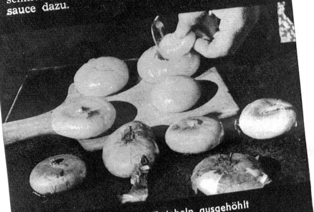
So werden die Zwiebeln ausgehöhlt

Zwiebeln, gut zubereitet, sind wirklich nicht zu verachten, sondern auch sehr schmackhaft. Pro Person rechnet man 1 grosse, schöne Zwiebel. Sie werden geschält und in wenig Wasser gedünstet. Dem Wasser einige Tropfen Zitronensaft beifügen und etwas, aber ganz wenig, Suppenwürze. Sind die Zwiebeln halbweich, werden sie sorgfältig herausgehoben. Nach dem leicht Erkalten lassen, wird mit einem silbernen Löffel das «Herz» herausgehoben. Nun wird das Ausgehöhlte mit etwas Peterli und Sellerie fein abgehöhlt. Unterdessen wird eine dicke Mehlsauce, die mit Milch und Trockenvollerei abgesehen ist, auf kleinem Feuer 10 Minuten gekocht. Die Zwiebelmasse, vermisch mit geriebenem Käse, einfüllen. Zuoberst ein Stück Fleischkäse, Schinken oder Speckscheibe legen. Im Oel in der Bratpfanne backen lassen. Sehr heiss servieren, und zwar auf gebräuten Brotschnitten. Liebhaber servieren eine Tomatensauce dazu.