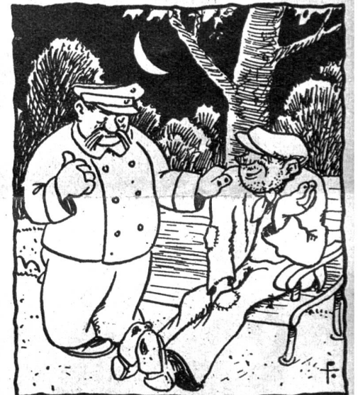
He, dir mir bschliesse jitz d'Türe Da heit dir rächt — villich wird's de a chli wärmer