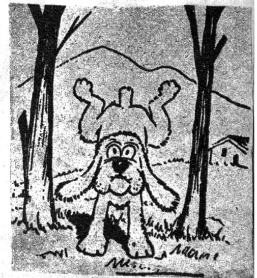
Fifi — oder wer die Wahl hat, hat die Qual

Waagrecht: 1. Verbindung. 4. Ungebrochenes Grasland. 6. Beginnen (Rennen). 8. Zu, englisch. 9. Polnischer Sagenheld. 11. Alt, englisch. 13. Orientalisches Gewand. 14. Vers. 16. Eingang. 17. Eisenstift. 18. Rumänische Stadt. 20. Italienische Stadt. 22. Artikel. 24. Französische Verneinung. 25. Französisches Fürwort. 26. Insel der Tongainseln. 28. Dir, italienisch. 29. Belgische Stadt. 31. Teil des Schiffes. 32. Meine, französisch (Mz.).