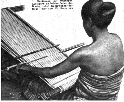
Oben: Auf der Insel Flores werden kostbare Tücher gewoben