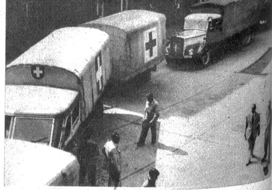
Schwere Lastwagen stehen im Dienste des Roten Kreuzes. Sie sind Helfer im Kampf gegen Not und Elend.

Links: Die Eisenbahn ist das Verkehrsmittel für Massentransporte und lange Strecken und ist deshalb aus dem modernen Verkehr nicht wegzudenken