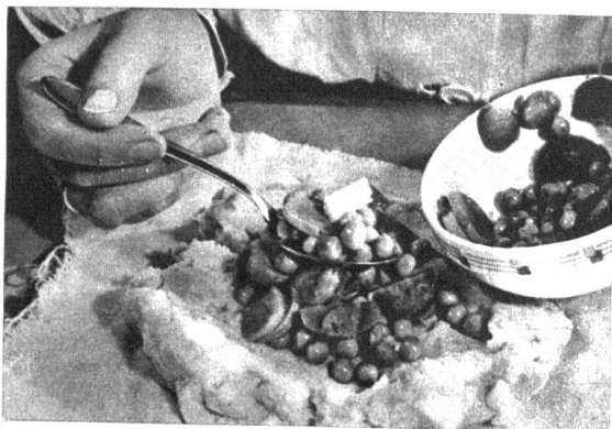
Der Pudding wird in ein gebrühtes Tuch gefüllt