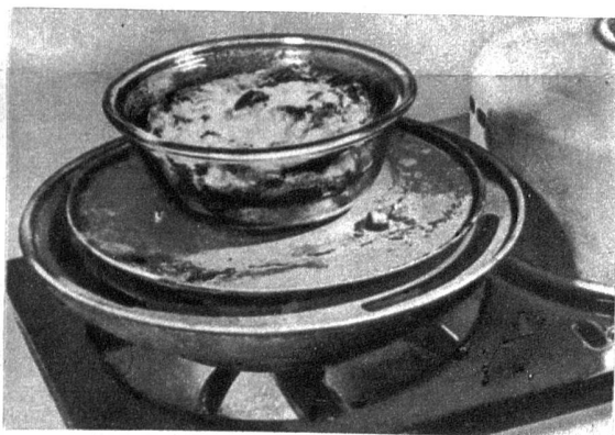
In der Gasbackform kann man diese Puddingmassen auch mit kleinen Förmchen backen

Die grosse Verwendungsmöglichkeit von Puddings, besonders gekochten, ist immer noch zu wenig bekannt. Aus diesem Grunde möchten wir unseren Leserinnen einige Rezepte geben, die in vielerlei Variationen immer wieder beliebt und schmackhaft sind. Wenn man wegen der Gasrationierung nicht zu viel Kochzeit verwenden darf, so wählt man am besten einen in einem Tuch eingewickelten Pudding, den man nur kurze Zeit direkt im Wasser kochen kann. Doch nur Puddings ohne geschlagenes Eiweiss vertragen diese Kochweise.