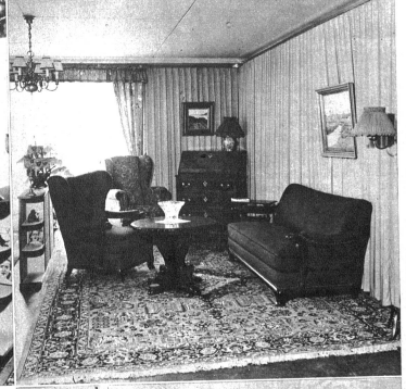
Eine gemütliche und doch vornehm wirkende Ecke Ausführung Arthur Wahlen, Bern