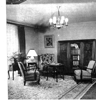
Ein schöner behaglicher Wohnraum (Fumoir) im Charakter des Barockstils. Der Bücherschrank kann auch als Buffetschrank verwendet werden Ausführung G. Hack, Bern