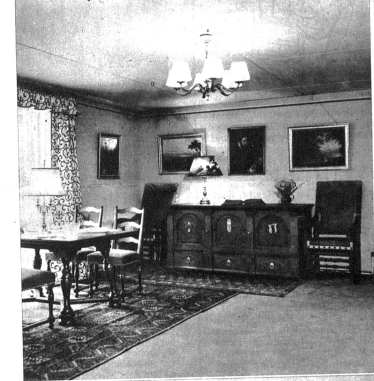
Blick in das Speisezimmer, im Hintergrund eine antike Truhe mit den Wappen von Erlach und von Scharnachtal aus dem Jahre 1520 Ausführung Th. Schärer's Sohn & Cie., Bern