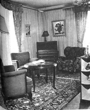
Eine sehr beachtenswerte Sitzgruppe (Ausführung Hans Bernet, Bern)

Man hat wohl das gute Alte gehalten, sich aber der neuen Zeit hörig angepasst. Schon das Zimmer der berufstätigen Frau ist ein Schritt vorwärts in unserer Aufzucht und beweist, wie das Gewerbe den Wünschen und der Notwendigkeit der Zeit Rechnung trägt. In dem kleinen Raum sind geeignete Sitzgelegenheiten geboten. Schreib- und Arbeitstisch entsprechen dem Zweck, wobei die Möbel in Form und Farbe den Anforderungen der Frau sehr gut angepasst sind. Der Raum ist zweckmässig und doch schön, wie es sich eine berufstätige Frau geziemt. Auch der Komposition von Möbeln wurde mehr Aufmerksamkeit gewidmet als bisher, denn die modernen Wohnungen des Tages bieten heute nicht immer viel Raum, um ganze Sitzgruppen im Zimmer aufzustellen. Einzelstücke sind daher zur Ergänzung vorhandener Einrichtungen notwendig. Gutes, wahrschafftes, neue Farben der Bezüge und behaglich verlockende Formen geben den Stücken die Eigenart, sie