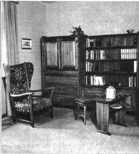
Der Raum einer berufstätigen Frau ist gemütlich und schön