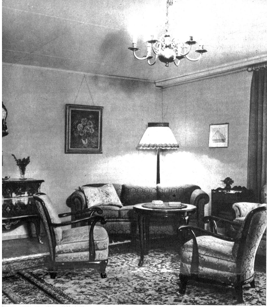
Der andere Teil des Fumoirs; die gut gewählten Formen der Möbelstücke geben dem Raum seine gediegene und ruhige Wirkung (Ausführung G. Hack, Bern)

Das bernische Tapeziergewerbe stellt im Gewerbemuseum eine Formschöner und gediegener Möbelausstellung dem Gewerbe das Zeugnis bekundend.