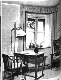
Ein Teil des Zimmers der berufstätigen Frau, Arbeitstisch mit Bockensstuhl und ein Blumenfenster