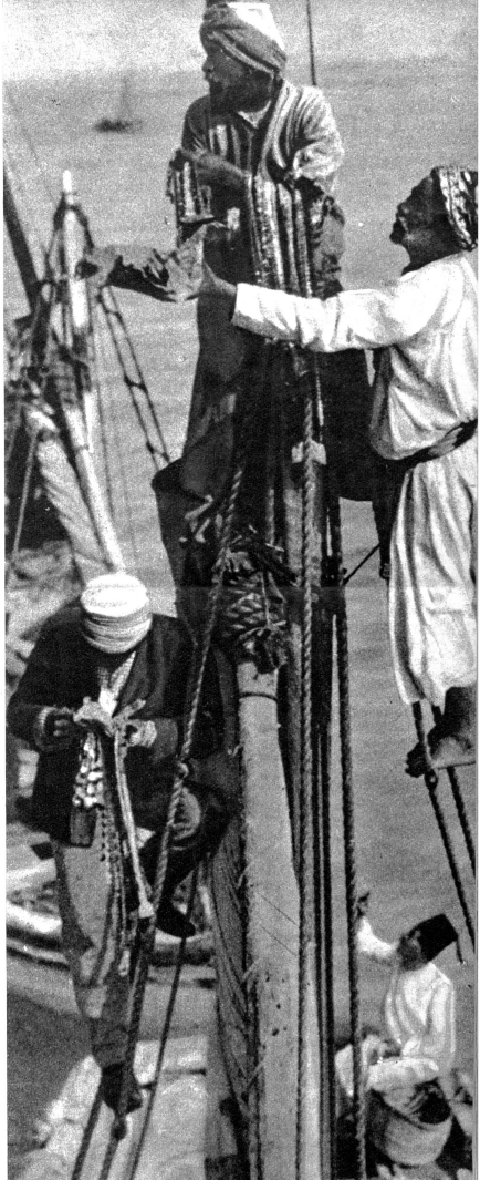
Rechts: Arabische Händler klettern an den Masten ihrer Segelboote umher, um ihren Kram auch dann an den Mann zu bringen, wenn schon das Betreten des Schiffes verboten ist. Links: Selbstbewusst schauen die arabischen Frauen in die Welt, seitdem sie nicht mehr gezwungen sind, unter schwarzen Schleier ihre Schönheit zu verbergen

Drei Tage dauert die Fahrt durch das Rote Meer. Die Reisenden verschlafen die Tage auf ihren Liegestühlen an Deck, denn die schwere, brütende Wüstenhitze macht jede Bewegung zur Last. Bei Aden öffnet sich die Unendlichkeit des Indischen Ozeans. Die Reisenden erwachen wieder, dem neuen Leben entgegengehend, das sie nach fünf-tägiger Fahrt in Indien erwartet.