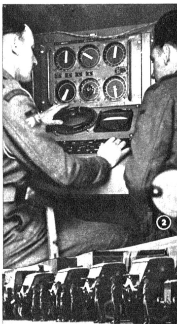
Vor dem Detachement für Radar-Demonstrationen in der Schweiz, das aus 3 Offizieren und 40 Mann besteht, präsentieren sich 4 Soldaten in der von der schweizerischen wesentlich abweichenden englischen Achtungstellung