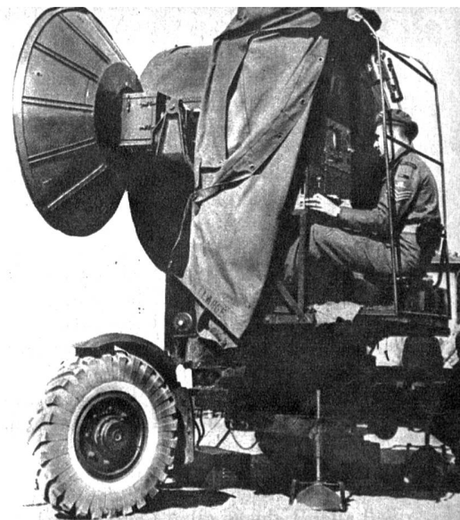
1 Radar und Scheinwerfer, übrigens motorisiert und daher besonders leicht transportierbar und sofort einsatzbereit, werden hier von einem englischen Unteroffizier bedient

Aus ihrer geheimnisvollsten Waffe, dem Radar, machen die Engländer kein Geheimnis. Im Gegenteil, auf Ersuchen der Kriegstechnischen Abteilung im Eidgenössischen Militärdepartement haben die Briten im Einverständnis ihrer Regierung und der Heeresleitung ein besonderes Radar-Detachement in die Schweiz beordert, um hier Radar-Geräte für die Steuerung von Flabgeschützen und Scheinwerfern vorzuführen