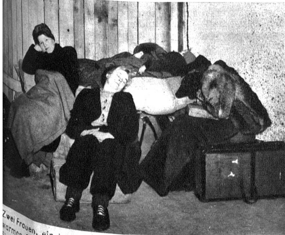
Zwei Frauen, ein junges Mädchen und ein Kind — alle in langen, warmen Skihosen, einige Koffer, Decken. Wohin führt der Weg? Sie wissen es selber nicht. Ausgewiesen, unerwünscht. Heim ins Reich

Anders in Oesterreich, unserem, von vier Mächten besetzten Nachbarland im Osten. Zwar zirkulieren im Verhältnis zu Deutschland, dank der elektrischen Traktion, der Unabhängigkeit von der Kohle, ziemlich viele Züge. Die Zonenschränken jedoch erweisen sich für einen geordneten Zugverkehr als gewaltiges Hemmnis. Der einzige Zug, welcher Paris mit Wien verbindet und bereits dreimal wöchentlich fahrplanmässig verkehrt. Jeder Bahnhof in Oesterreich bietet heute ein Bild grösster Trostlosigkeit. In den Restaurationsräumen und den Wartsälen drängt sich eine hoffnungslose Menschenmenge, demobilisierte Wehrmachtsangehörige, Rückwanderer aus dem Reich, aus Oesterreich ausgewiesene Reichsdeutsche, und je nach der Zone französische, amerikanische oder englische Soldaten. Alle verbindet der gemeinsame Wunsch, es möchte sich möglichst bald eine Fahrgelegenheit bieten. Aber bis ein Zug heranbraust, vergehen endlose Stunden — und durch die leeren Tür- und Fensterrahmen bläst eine eisige Biese. Da sitzen und liegen sie dann, die Menschen ohne Heimat, versuchen, in ihre Mäntel und Decken eingewickelt, auf Bänken oder auf dem Fussboden einzuschlafen, Hunger und Kälte zu vergessen. Kleinbahnidyll? Nein! Tragik eines kleinen Ländchens.