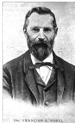
F. A. Forel 1841—1912

Er ist der Erfinder des nach ihm benannten Augenspiegels . Dank minutiöser Untersuchungsmethoden gelang es Haab, zahlreiche neue Krankheitsbilder des Auges festzustellen. So sind vor allem zu erwähnen seine Entdeckungen über die Veränderung des gelben Flecks im Alter und nach Verletzungen. Schon 1885 entdeckte er den nach ihm benannten Hirnrindenreflex der Pupille. Von grosser Bedeutung für die Unfallchirurgie des Auges war die Einführung des Riesenmagneten, der die schonende Entfernung sehr kleiner Metallsplitter aus der hintersten Zone der Linse ermöglicht.