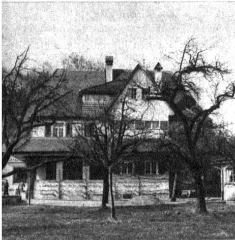
Das Heim des Künstlers in Oschwand bei Herzogenbuchsee