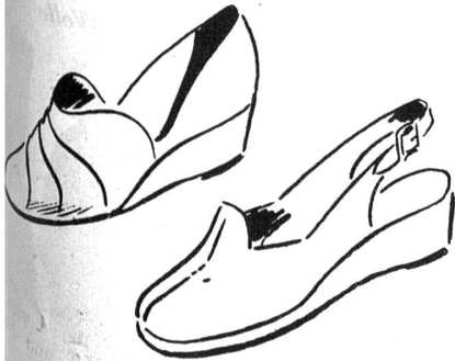
Der jugendliche Keil-Pump

Es ist nicht schwer, einen Frosch ins Wasser zu jagen. Aber noch viel weniger schwer war es, der freundlichen Einladung der Bally Schuhfabriken zu folgen, ihre neue Frühjahrs- und Sommerkollektion zu besichtigen. Herr Dir. Klinger der Agor AG. (Bally Propaganda), der die geladenen Gäste in Zürich im Hotel Bellerive willkommen hiess, erwähnte einleitend, dass die Schwierigkeiten in der Beschaffung von Leder immer noch enorm sind und noch ein bis zwei Jahre andauern werden. Die reichhaltige Kollektion, die wir aber zu sehen bekamen, liess in nichts diese Schwierigkeiten erkennen. Ideen-