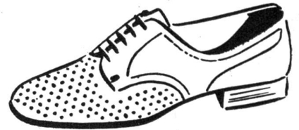
Der gelochte Herren-Schuh

In der Reihe der Abendschuhe findet man eine Anzahl ganz entzückender Mo-