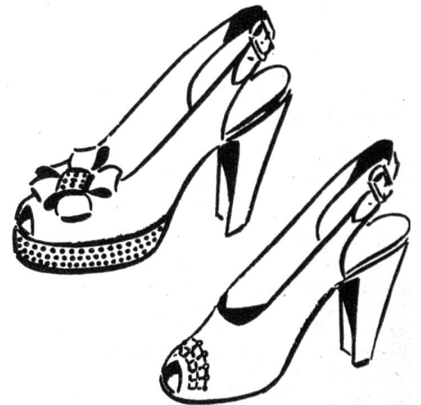
Zwei repräsentative Abendschuhe aus der USA-Export-Kollektion

Bei der Herrenkollektion fiel vor allem ein englischer Schuh mit Doppelsohle auf, der in seiner praktischen Eleganz viele Liebhaber finden dürfte. Daneben zeigten eine Reihe praktischer und schöner Sandaletten, dass auch hier der wärmeren