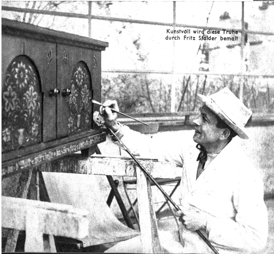
Kunstvoll wird diese Truhe durch Fritz Stalder bemalt

anzutreffen und mancher Trog wurde aufgerichtet und erhielt wieder seinen Ehrenplatz in der Wohnstube. — Dies war nur möglich dank langjähriger Pionierarbeit und dank dem unermüdlichen Schaffen und Können einiger tüchtiger Fachleute.