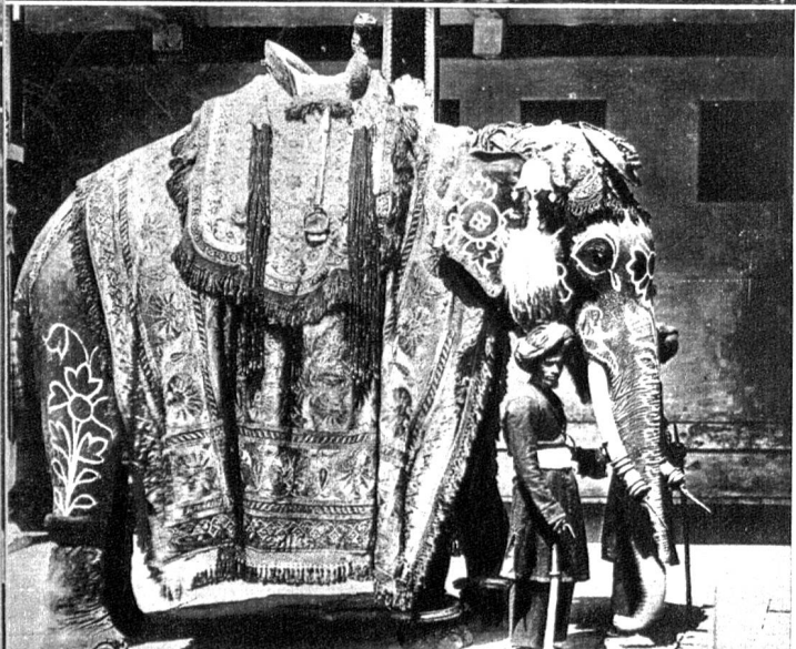
Links: Zahlreiche Fürsten besitzen in Indien grosse Ländereien, die sie unter englischer Vorherrschaft ziemlich selbständig verwalten. Unser Bild zeigt den für einen Ausritt geschmückten Elefanten des Maharadschas von Mysore