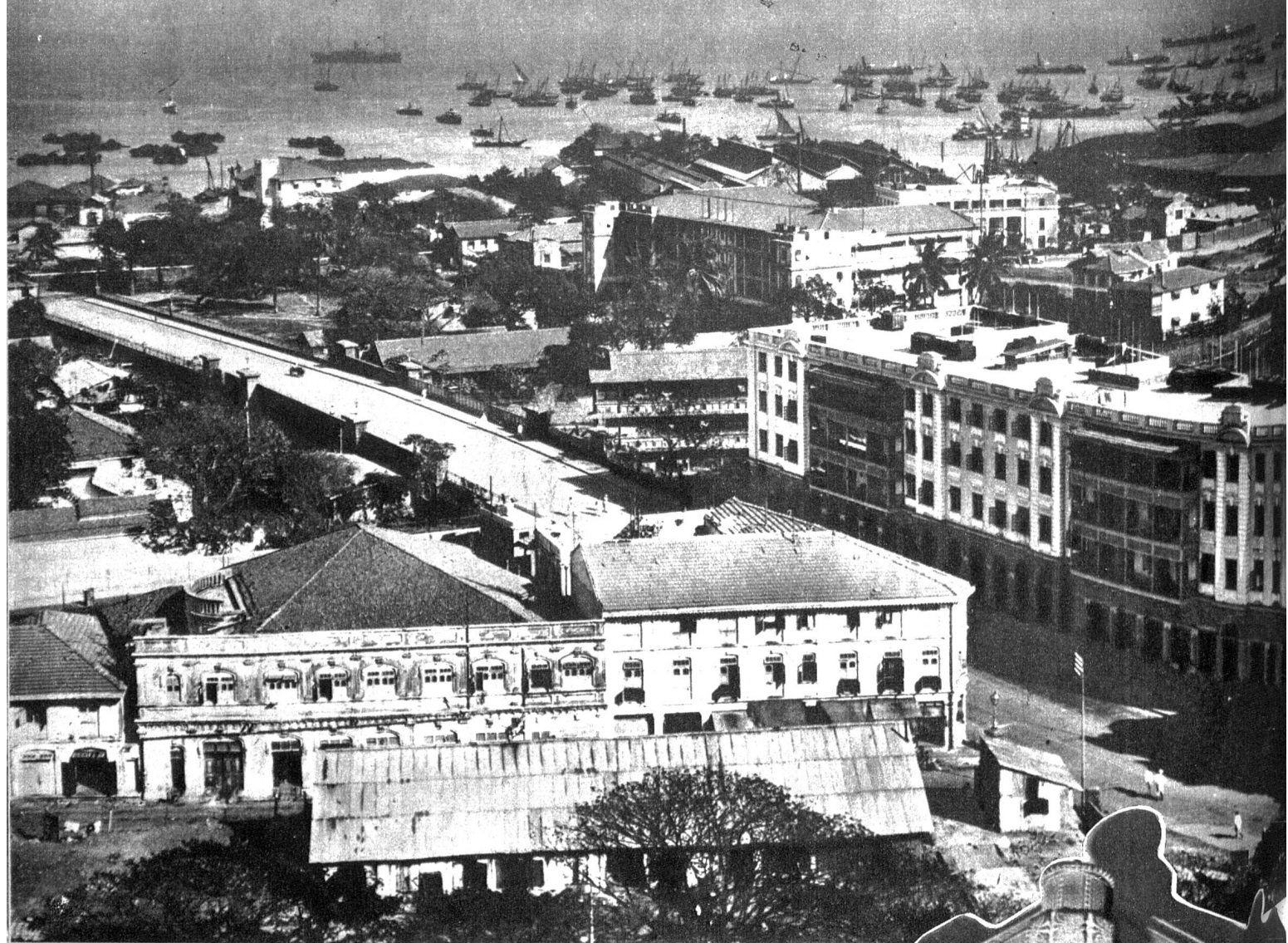
Oben: Teilansicht von Bombay, diese bedeutendste Hafenstadt Indiens bildet das Eingangstor zu der reichsten Kolonie Grossbritanniens