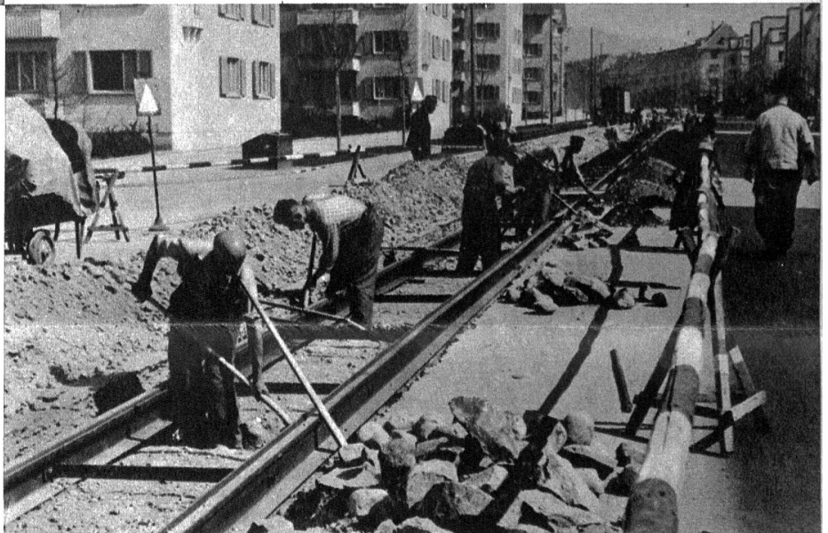
Zwischen den neuangelegten Schienen werden die Löcher für Betonquerswellen gegraben

Wer sich in den prächtigen Frühlingstagen, die uns dieses Jahr durch ihre Vielzahl ja richtig verwöhnten, etwa einmal draussen im Ostquartier unserer Stadt aufhielt, dem fiel sicher die dortige bauliche Betriebsamkeit auf. Er stellte fest, dass nicht nur immer mehr Mietshäuser erstellt werden, die helfen sollen, die akute Wohnungsnot zu mildern, sondern, dass vernünftigerweise auch mit der Arbeit begonnen wurde, die sich das Ziel gesetzt hat, das neue