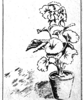
Geranien für Fenster und Balkon

Gärtnerei in Wabern, Tel. 5 23 88 Blumengeschäft am Kornhausplatz, Tel. 2 09 75