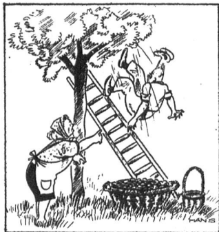
«Egon, pass auf, die Pflaumen stehen hier»