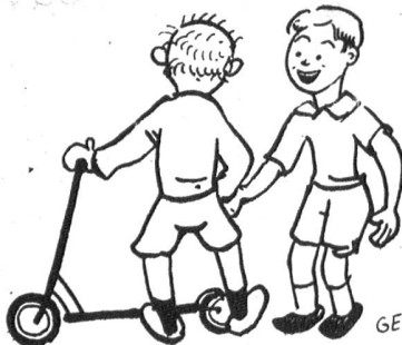
«War dein Husten auch so schlimm?» «Mensch! Viel schlimmer. Bei mir war er in den Ferien»