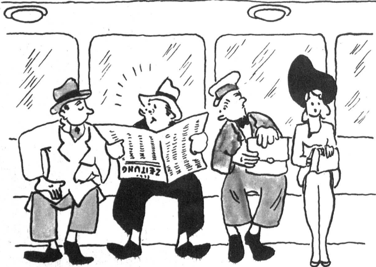
«Haha, ist Ihnen wohl so nicht recht?»