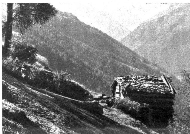
Im Val d'Anniviers

Wasserwerksgasse 17 (Matte) Telephon 22612