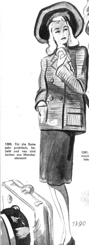
1390. Für die Reise sehr praktisch, beliebt und neu sind Jacken aus Manchestersamt