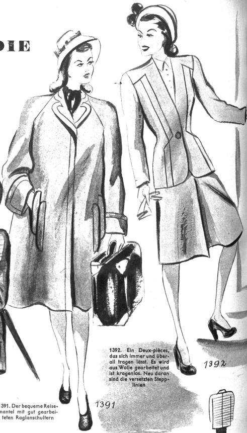
1391. Der bequeme Reisemantel mit gut gearbeiteten Raglanschultern