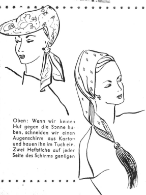
Oben: Wenn wir keinen Hut gegen die Sonne haben, schneiden wir einen Augenschirm aus Karton und bauen ihn im Tuch ein. Zwei Heftsche auf jeder Seite des Schirms genügen

Zugegeben, das Spiel ist nicht neu, wir spielen nun schon einige Jahre mit den hübschen, bunten Bauertüchern. Aber, den Reiz des Spieles machen die immer neuen Varianten aus, die unerschöpflichen, sich der neuen Mode anpassenden Arten des Zusammenfaltens, Schlingens und Drapierens. Das Bauertuch ist uns ein unentbehrlicher Begleiter durch den ganzen Sommer, es springt ein, wenn wir gegen die Sonne keinen Hut haben, wenn der Wind uns die Locken verzausen will, wenn wir am kühlen Abend einen Schulterwärmer brauchen und, wenn es gross genug ist, sogar wenn wir das Badekleid vergessen haben. Es lebe das bunte Bauertuch!