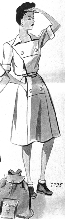
1395. Sehr modern ist dieses Kleid mit dem beliebten viereckigen Halsausschnitt. Der Vorderteil ist in origineller Form geschnitten und hat einen Kettverschluss am Gürtel