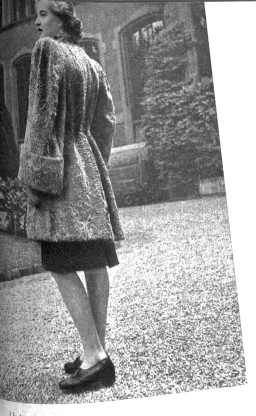
Unten: Einfaches weisses Sommerkleid mit bunter Stickerei am Vorderteil

Verbringt man seine Ferien an den Bergen, so tut man gut daran, wärmeres Kleidungsstück mitzunehmen. Der leichte Sommer-Pelzmantel aus grauem Indisch-Lamm von der Preis-Bieler, Thunstrasse 2, eignet sich besonders dazu. Er ist gar nicht delikat, kann sowohl als Abendmantel als auch als Tag getragen werden und ist mit seinen Phantasietaschen und weiten Ärmeln äusserst bequem für Ferien und Reisen