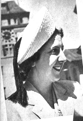
Ein junges Mädchen mit aus weissem Stroh mit schwarzer Quaste, das sich besonders für die Reise eignet Modell H. Haldemann