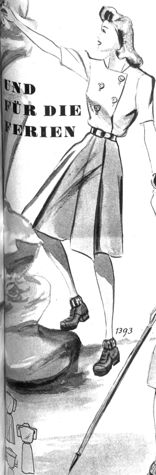
1393. In den Bergen lieben wir ganz einfache Kleidung. Unsere Bluse hat einen versetzten Knopfverschluss. Dazu wird der praktische Hosenrock getragen