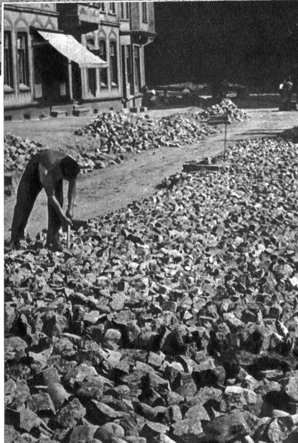
Oben: Mit kräftigen Fäustel-Schlägen werden die Blöcke hier zerkleinert, bis sie das richtige Mass für den gewünschten Zweck haben