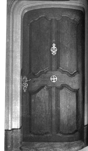
Vorstülpige Barocktüre des Hauses Kesslergasse 2. Hier der fehlende Türklopfer sollte ersetzt werden

«Recht so, guter Freund!» ruft der Graf schmunzelnd aus. «Das glaube ich gern, dass du diesen Thron nicht gegen meinen eintauschst...!»