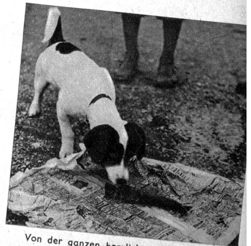
Von der ganzen herrlichen Wurst bleibt nichts als Wasser und Haut