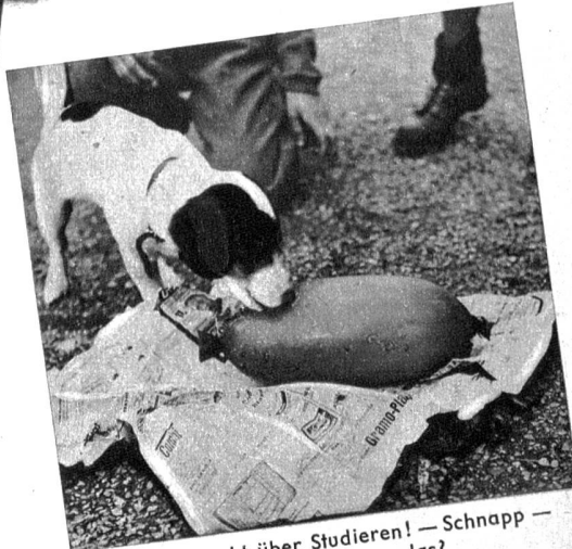
Probieren geht über Studieren! — Schnapp — Was ist denn nun das?