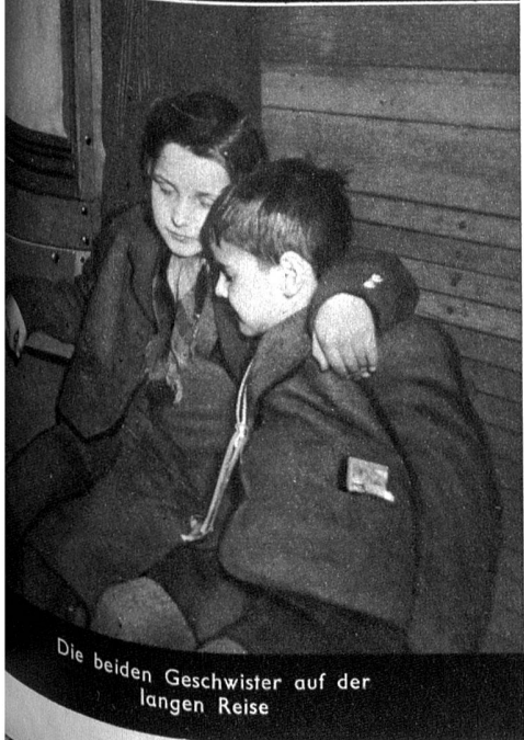
Die beiden Geschwister auf der langen Reise