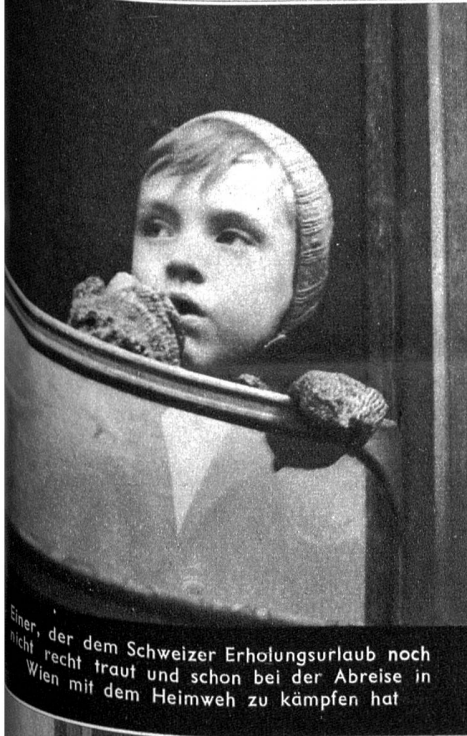
Einer, der dem Schweizer Erholungsurlaub noch nicht recht traut und schon bei der Abreise in Wien mit dem Heimweh zu kämpfen hat