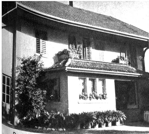
Das Wohnhaus mit dem Werkstattgebäude