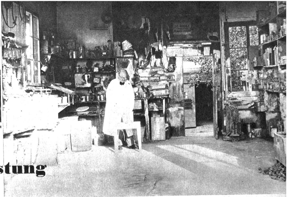
Materialraum mit dem Durchblick zur Werkstatt und Spritzraum