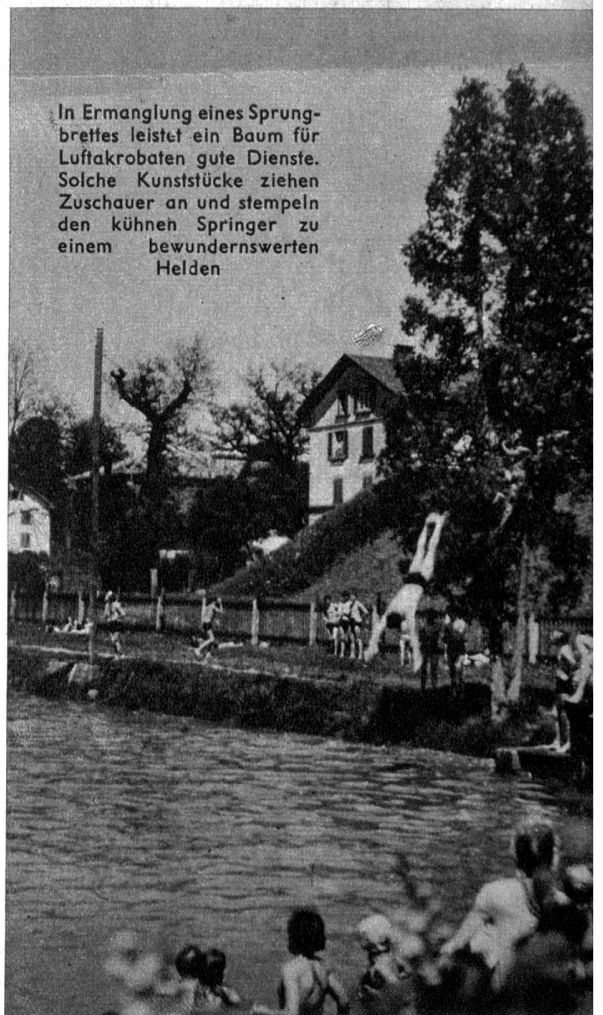
Links: Zum Bad gehört ein Ballspiel unter Kameraden auf der grünen Wiese. Mit der Velopumpe wird der Ball aufgeblasen. Achtung, dass der Gummi nicht platzt! Neugierige Buben warten schadenfreudig auf den erhofften Knall

In Ermanglung eines Sprungbrettes leistet ein Baum für Luftakrobaten gute Dienste. Solche Kunststücke ziehen Zuschauer an und stempeln den kühnen Springer zu einem bewundernswerten Helden