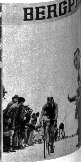
Seppli Wagner auf dem 2. Platz im Gesamtklassement. Links: Seppli Wagner beim Erklettern der Jaunpasshöhe und (oben) wie er sich nach dem Etappensieg am Ziel in Bern den Siegereinkuss einholt. Mitte: Ueber die Teufelsbrücke hinweg zog Bartali an der Spitze los, von Ronconi und Trueba gefolgt. Rechts: Sieger der Tour de Suisse 1946 wurde der Italiener Bartali. Wir sehen ihn auf der San Bernardino-Passhöhe als ersten, gefolgt von Trueba (Spanien).