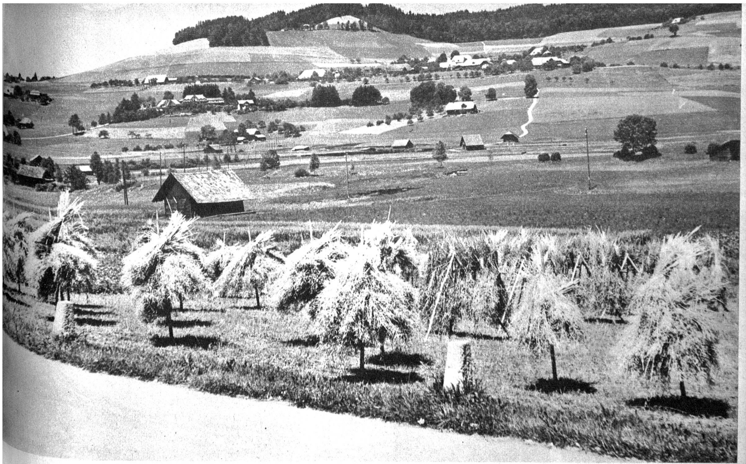
Landschaft gegen Biglen, links im Hintergrund das bekannte Rütihubelbad

volkskundlicher Begriff, es ist zweifellos auch geologisch und orographisch bestimmbar. Und doch lässt es sich nicht mit Begriffen allein einfangen.