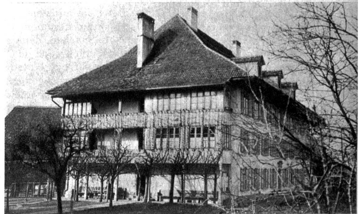
Dieses Gebäude war bis zum Jahre 1770 ein Siechenhaus, dann ein Waisenhaus und jetzt der Burgerspital