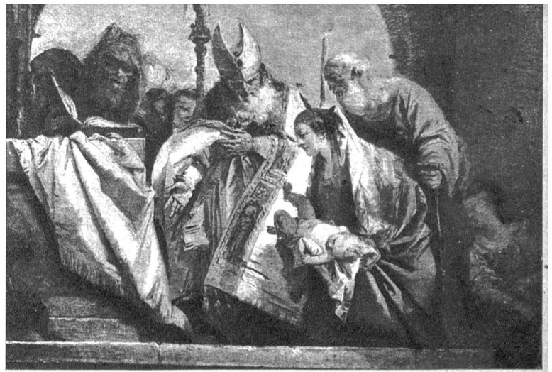
Giovanni Battista Tiepolo (1695—1770). Darstellung im Tempel