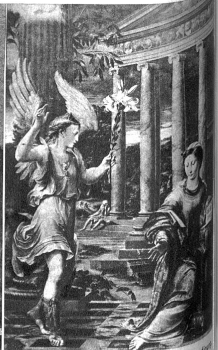
Gerolamo Mazzola, 1500—1569. Verkündigung Mailand (Ambrosiana)