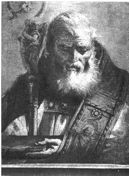
Giovanni Battista Tiepolo 1695—1770. Heiliger Bischof, Mailand (Ambrosiana)