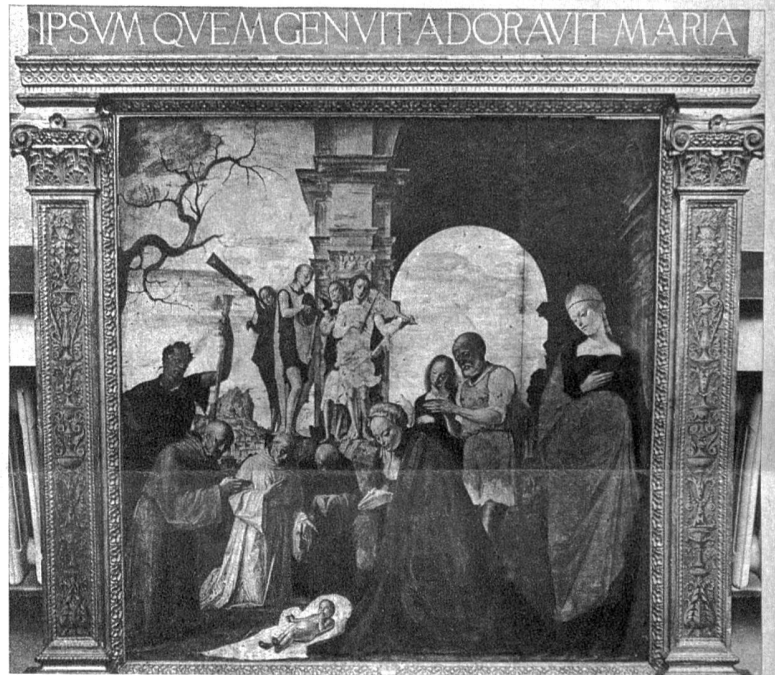
Bartolommeo Suardi, genannt Bramantino (um 1460—1536). Die Anbetung des Kindes. Mailand (Ambrosiana)