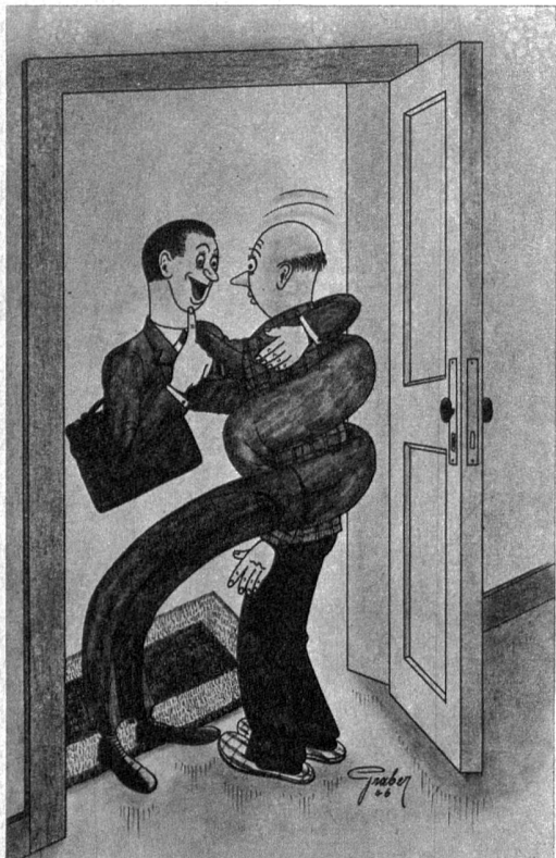
Ein ganz füchtiger Versicherungsagent