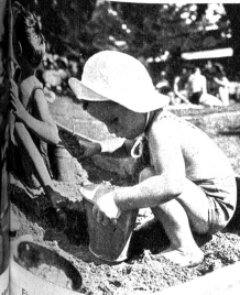
Ein kleines fleissiges Sandmännchen