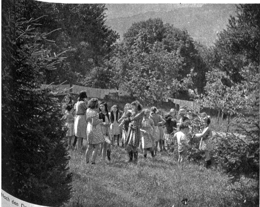
Nach den Drangsalen des Krieges freuen sich die Kinder doppelt, auf einer Wiese nach Herzenslust spielen zu können. In St. Martin s/Arve