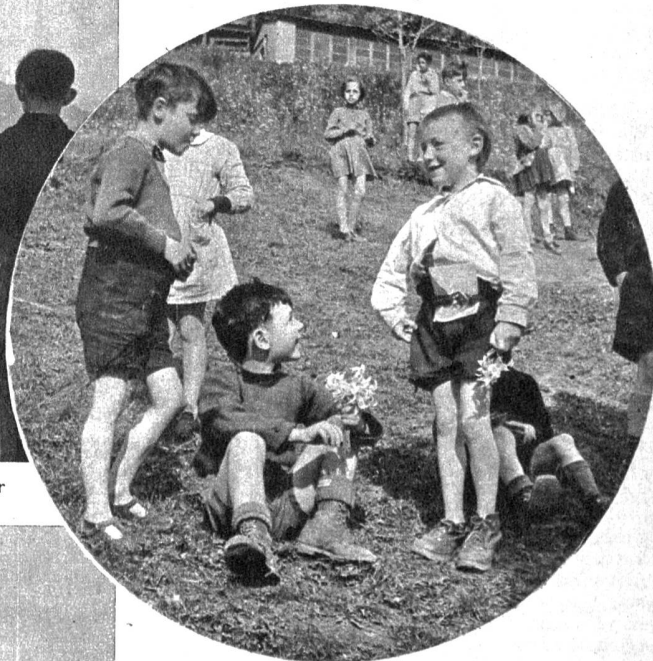
Die Stärkungsmittel aus der Schweiz scheinen den Buben gut anzuschlagen