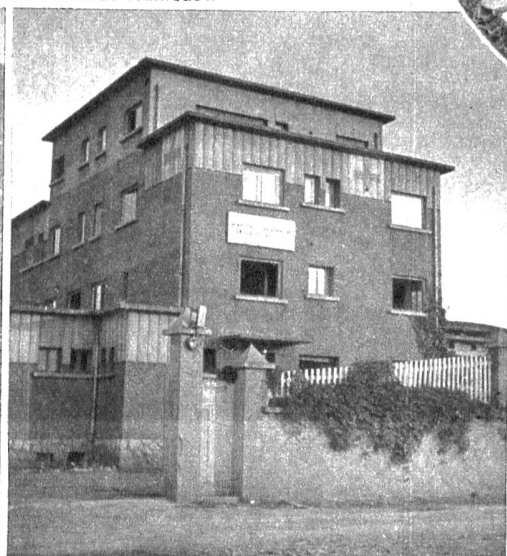
Früher hiess es «Hôtel du Salève» in Ambilly bei Annemasse, dann wurde es zu einem «Centre de Repatriement» für kriegsgefangene Franzosen und heute beherbergt das Haus 60 erholungsbedürftige Buben von 8 bis 12 Jahren