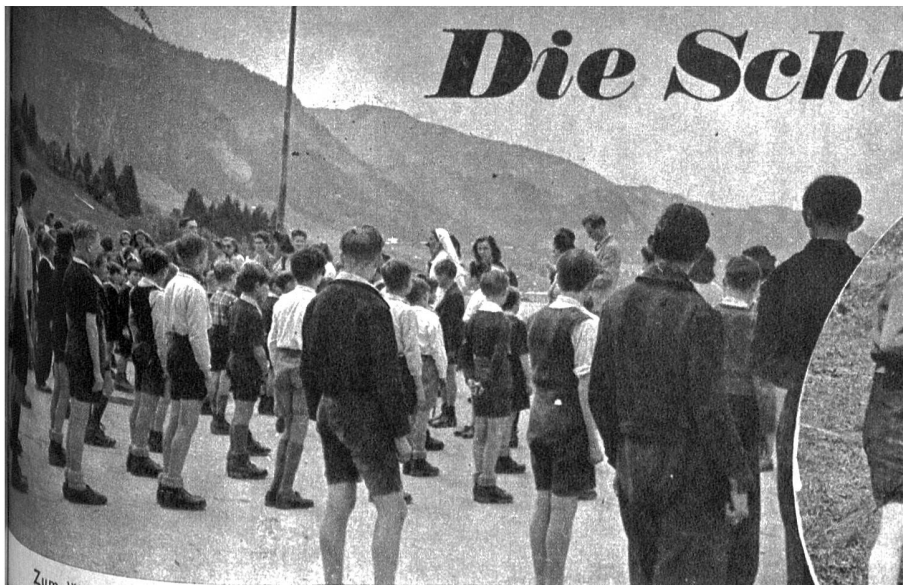
Zum Willkommen der Freunde aus der Schweiz flatterte die Schweizer Fahne auf der Dachterrasse von «Le Hameau»