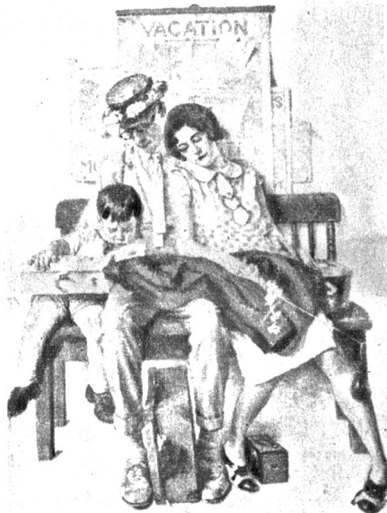
Ausgeruht kommen wir aus den Ferien zurück.