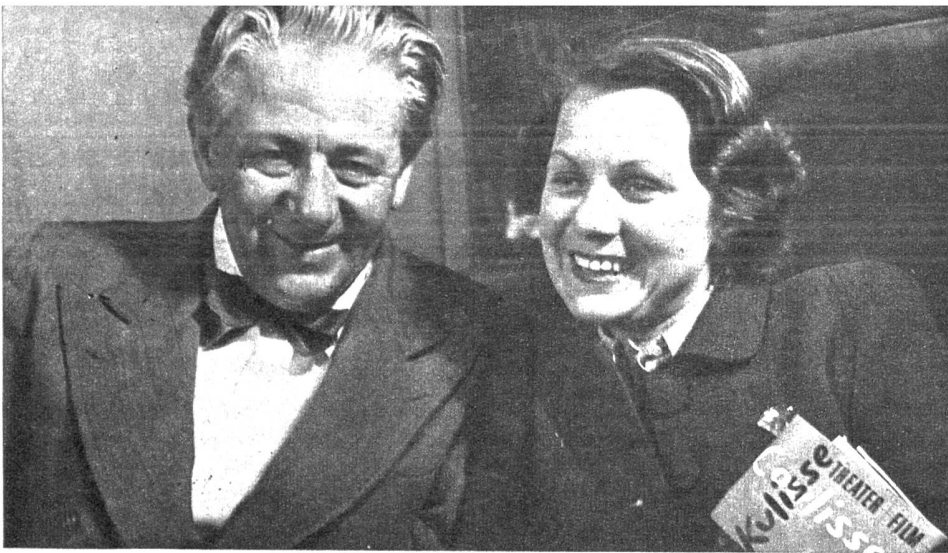
Paul Hörbiger und Grete Heger in Franz Molnar's Lustspiel «Die Fee». Am 6., 7., 8. September wurden im Berner Alhambatheater die Abschiedsvorstellungen gegeben; anschliessend trennten sich die beiden hervorragenden Schauspieler wieder von der Schweiz. Paul Hörbiger folgt einem Engagement in die Vereinigten Staaten, und Grete Heger möchte nach langjährigem Schweizer Aufenthalt Wien, ihre Vaterstadt, wiedersehen. (Aufnahme Carl Jost, Bern, anlässlich des Presse-Empfangs im Corso)

bis zum Kranz der Berge zurückbrachte. In diesem Land waren die Ströme grösser, breiter, die Städte gewaltiger, erdrückend. Aber für Kate verblassten sie vor dem Bild der Heimat.