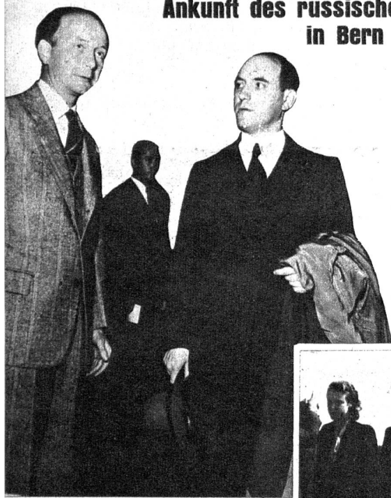
In der vergangenen Woche ist der neue russische Gesandte in der Schweiz, Minister Kulashenkow, mit einem Teil des Gesandtschaftspersonals in Bern eingetroffen. Er kam in Begleitung von Legationsrat Dr. Cuttat, Chef des Protokolls, der den Gesandten in einem schweizerischen Postauto in Dübendorf abholte. Unser Bild zeigt den russischen Gesandten, Minister Kulashenkow (rechts) mit Legationsrat Cuttat bei seiner Ankunft in der Halle des Hotel Bellevue-Palace in Bern. Oben rechts: Erstmals flattert die Flagge der Sowjetunion über Bern