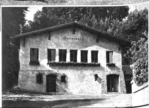
Die Talstation der Gurtenbahn