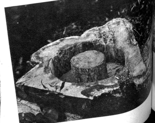
Das meiste Wild hat das Bedürfnis nach Salz. Diesen «Gelüsten» kommt der Jäger in der Weise nach, dass er an geeigneten Stellen Salzlecken, meist unter Verwendung von Baumstrüngen, anlegt. Mit der Zeit wird der ganze Baumstrunk durchsalzen. Das Rehwild leckt dann an diesen Baumstümpfen und schlüsselt sogar das Holz davon ab. Die Verabreichung gewisser Salze dient auch der Gesunderhaltung des Wildes