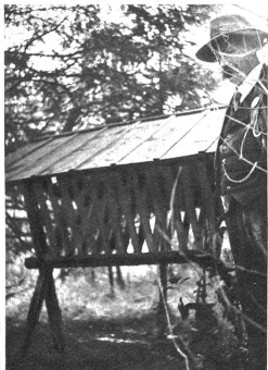
Futterkrippe im Walde für die Winterfütterung des Wildes. Diese Massnahmen rechtzeitig zu treffen, gehört zu den Pflichten eines richtigen Jagdaufsehers