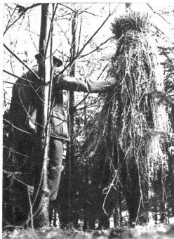
Wenn der harte Winter hereinbricht, leidet das Wild oft schwere Not. Dem begegnet der tierliebende Revierjäger, indem er das Wild füttert — in diesem Falle durch Aufhängen von Hefergarben, die besonders vom Rehwild gerne angenommen werden