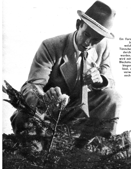
Ein Forstmann zeigt den Jagdaufsehern, in welcher Weise junge Tännchen gegen Verbis durch Rehe geschützt werden. Der Gipfeltrieb wird mit einem zackigen Blechstück, das sich leicht biegen und befestigen lässt, versehen. Häufig verwendet man dazu auch Werg (Chuder)