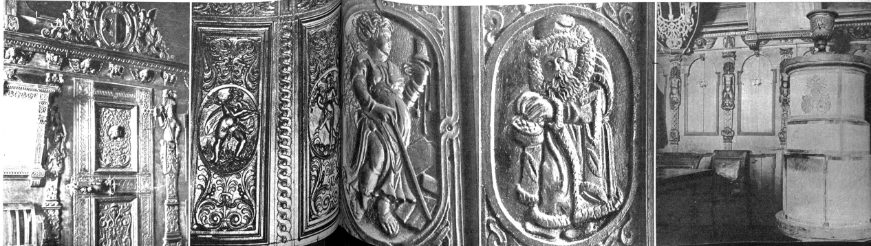
Im Bürgersaal. Zwischen den reichgeschmückten Täfer-Tragsäulen steht der prächtige, alte, wappengeschmückte Evolener Specksteinofen mit dem kaiserlichen Emblem

In den Gassen, die zu den Hügeln von Sitten emporsteigen, begegnen uns entzückende Häuser aus dem 15. und 16. Jahrhundert mit kunstvoll handgeschmiedeten Balkongeländern und reichgeschmückten, prachtvoll geschnittenen Türen. Im Herzen der Stadt aber befindet sich als Meisterwerk vergangener Architektur das 1660 bis 1668 erbaute Rathaus. Seine Türen bergen einen unvergleichlichen Reichtum an wundervollen Holzschmitten. Betrachtet man die Einzelheiten dieser Schnittereien von nahem, so sieht man sofort, dass eine vollkommene und gewissenhafte Kunstauffassung die Hand jenes Altmeisters in einem Zeitalter geführt hat, da die Menschen nicht nur mit ganzem Herzen, sondern auch mit wahrhaft geschulten Händen ihre kunsthandwerkliche Arbeit verrichteten. Die obere Türfüllung stellt Salomons Urteil dar, eine Arbeit von wundervoller Klarheit und Harmonie, bei der die Pracht der Ornamentik und die ausgeglichene Bewegung der Figuren die biblische Szene in ergreifender Wahrhaftigkeit wiedergeben. Die untere Füllung birgt ein Fratzens Gesicht in aussergewöhnlich reicher Ornamentik, die sich in dem Rahmen wiederholt und die Vollkommenheit der Hauptfüllung erst recht unterstreicht. Zu unterst an der Türe, in Schutz eines kleinen, von geschmiedeten graziosen Konsolen getragenen Dächleins, steht die lateinische Inschrift: Fecit iudicium et iustitiam et: Dedit pacem in finibus vestris. Auch im Innern dieses prächtigen Gebäudes verbreitet sich überall auf