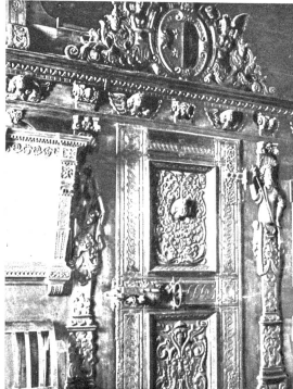
Türe zum ehemaligen Grossratsaal, obere Füllung: rechts Merkur (Luft), links Vulkan (das Feuer)