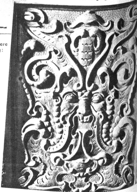
Fratzens Gesicht an der Eingangstüre am Rathaus

Türen und Holztafeln ein seltener Reichtum an handwerklicher Kunst. Der ganze Bürgersaal ist ein einziges Kleinod. Die Decke mit den zwar wenig in Erscheinung tretenden Kassetten, die überaus reich geschnittenen Täfer, der wappengeschmückte, von zwei Engeln getragene Türgiebel, der alte Evolener Specksteinofen, der ebenfalls das Wappen der Stadt trägt, darüber der kaiserliche Adler... das alles zusammen widerspiegelt aufs herrlichste die innenarchitektonische Schönheit, wie sie unsere Vorfahren verstanden haben.