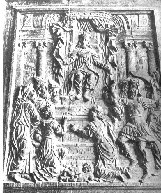
Detail der oberen Füllung an der grossen Eingangstüre: Salomons Urteil

Vom Bürgersaal gelangen wir in den ehemaligen Grossratsaal mit seiner ebenfalls prachtvoll geschnittenen Türe, deren obere Füllung links Vulkan, das Feuer, rechts Merkur, die Luft, darstellt, während sich Neptun (das Wasser) und Cybele (die Erde) in die untere Füllung teilen. Der rechte Rahmen ist mit Löwenköpfen geschmückt, und die symbolischen Figuren für die Wahrheit, den Frieden und die Vorsicht, die Gerechtigkeit und die Fruchtbarkeit zieren die Säulen. Die allegorischen Schnittereien in der Innentüre dieses Saales stellen die oberen Füllung rechts Ceres, links Adam und Eva dar. Ueber der Tür befindet sich die Kassette einer goldenen Uhr. Das Täfer dieses Saales ist etwas nichteiner. In dem gleichen Stockwerk begegnen wir noch zwei anderen, ebenfalls prachtvoll geschnittenen Türen, deren obere Füllung Merkur und Vulkan, die andere die Veründung von Adam und Eva mit den Schlangenschildern darstellen. Das Rathaus von Sion gilt unbestritten als ein Kunstwerk ersten Ranges für alle Kunster. Fügen wir hinzu, dass im Erdgeschoss die ganze Epoche der Mauern an die römische Zeit des Christenmonogramms erinnert, so wird die Bedeutung der lateinischen Inschrift: Eine Tür 977 einen Teil der Gebäude hatte ein Programm lassen. Dieses Christenmonogramm legt Zeugnis ab von dem im Wallis.