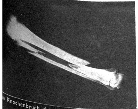
Knochenbruch durch Verdrehung, wie es nun nicht mehr vorkommen soll