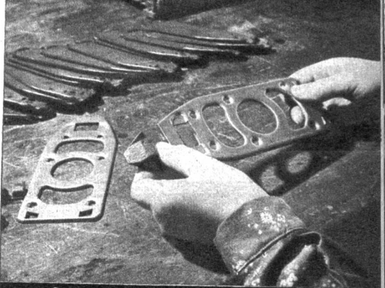
Serienmässige Herstellung der Stahlplatten