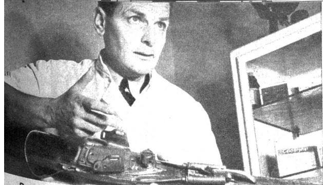
Der Erfinder der «Nefracta», ein bekannter Arzt und Chirurg in Zürich