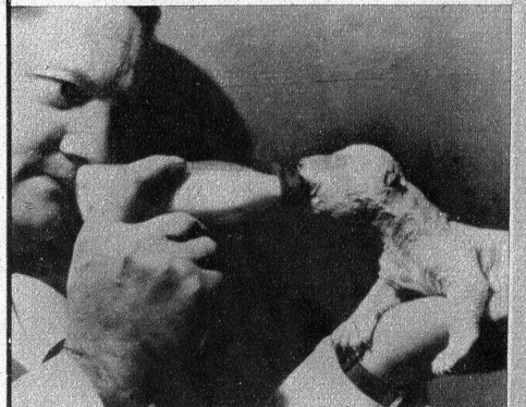
Am 12. Dez. erblickte im «Zoologischen» von Cincinnati ein Eisbär das Licht der Welt. Er wog bei seiner Geburt nicht ganz ein Pfund und muss nun vom Tierarzt mit allen Mitteln der Kunst aufgepäppelt werden

Was uns bis heute noch gefehlt hat, und was sich bis jetzt jeder Maschinenschreiber sehnlichst wünschte, die «fehlerlose» Schreibmaschine, ist erfunden. Eine Neuyorker Gesellschaft hat kürzlich eine Schreibmaschine patentieren lassen, bei der es unmöglich ist Schreibfehler zu machen. Wenn der Maschinenschreiber eine Zeile geschrieben hat, hat er die Möglichkeit Tippfehler zu löschen und Korrekturen anzubringen, da die Schreibzeile sichtbar gemacht wird, bevor sie durch Tastendruck «gesetzt» werden kann. Unser Bild zeigt ein Modell dieses wahren Schreibmaschinenwunders