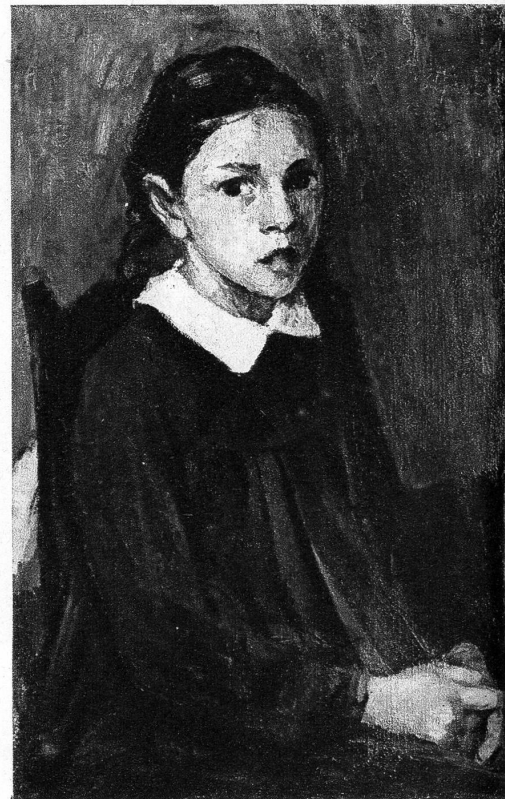
Mädchenbildnis « von Fritz Ryser »

Der Vormittag schlich träge und langsam dahin. Keller ging ruhelos, von der Hitze gepeinigt, in Haus und Garten umher, grübelte und sann, aber ohne die rechte innere