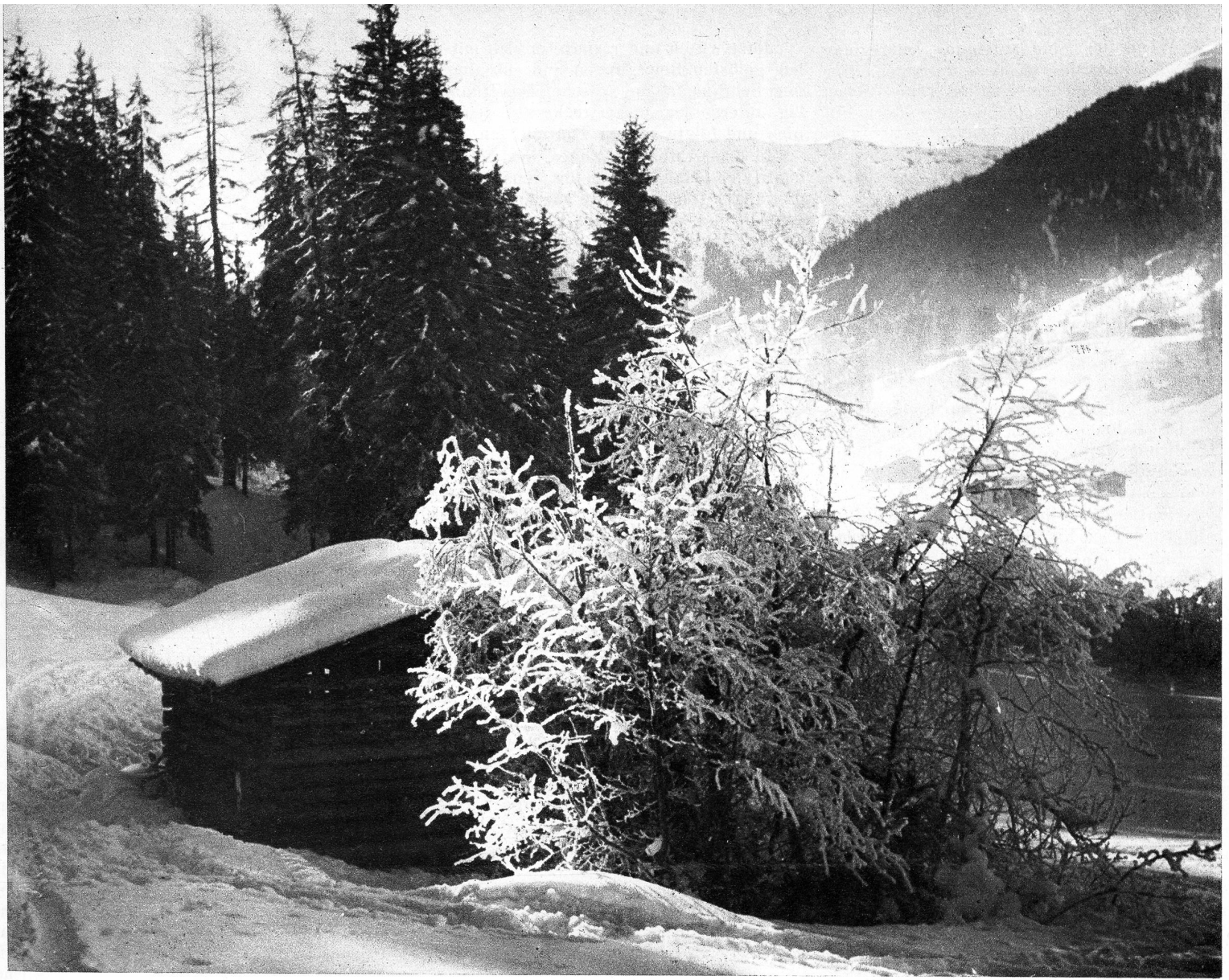
Auch der entlegenste Winkel erhält einen Sonnenstrahl

Dieses Bild, wie sie dalag, auf weissen Kissen, quälte ihn bis ins innerste Herz.