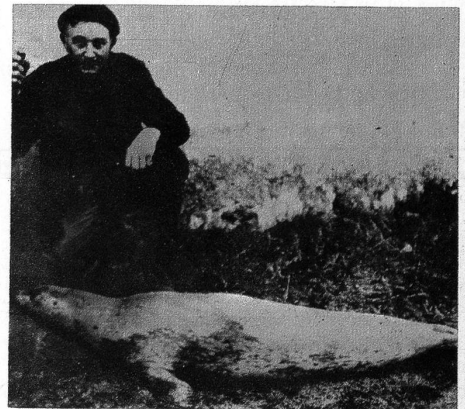
Einen seltenen Fang machte dieser Tage ein Landwirt in der Nähe von Bordeaux. Er sah in der Gironde einen Seehund schwimmen, der sonst nur in den Gewässern des hohen Nordens anzutreffen ist. Der Mann ergriff eine Flinte und konnte das Tier, das eine Länge von 1,5 m hatte,