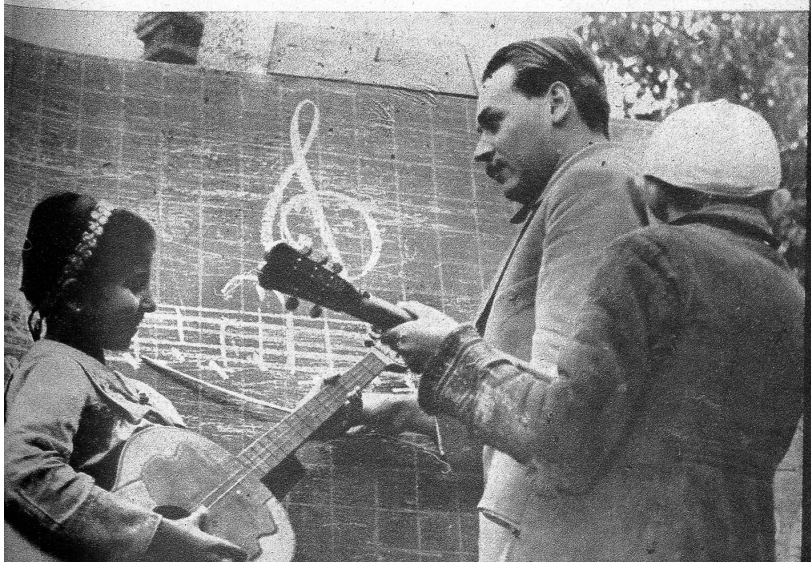
Vor der Wandtafel wird den Schülern das Notensystem auf einfachstem Weg gezeigt