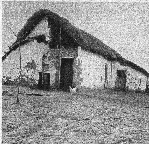
Zigeunerhüte im Gebiet von Fünfkirchen