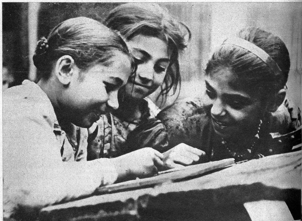
Drei Schülerinnen, ein Griffel und eine Schiefertafel

Menschengehässigkeit für Augenblicke restlos vergessen lassen.