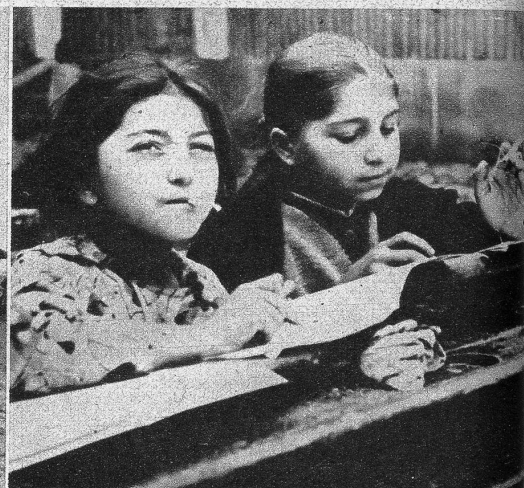
Rauchen ist in der Zigeunerschule den Kindern über sechs Jahren gestattet