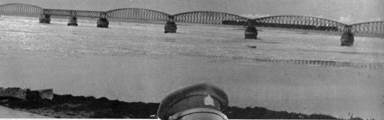
Über diese Brücke - Holländische Diep zwischen Breda und Rotterdam - fährt toeben der Express Basel-Amsterdam

Ich will an diesem Abend Amsterdam erreichen und halte mich nicht auf. Zeitweise bricht die Sonne für einige Minuten durch, beleuchtet das wellige Land und die sauberen Gehöfte, die sauberen Dörfer, Löwen, mit seinem prachtvollen Rathaus, Malines (Mecheln) sind auf den schönen Strassen sehr schnell erreicht und passiert. Antwerpen, die Königin des belgischen Aussenhandels, wird auf der Durchfahrt ebenfalls nur gestreift, und übrige wird in Antwerpen gestreift, und es wird geschossen und geräut, beim hellen Tageslicht, man verpasst nichts, wenn man sich an die breiten Durchgangsstrassen, die beim Scheiteltunnel vorbeiführen, hält. Zur Abwechslung kommt wieder eine schnurstrahle Chaussee, von hohen Ulmen umsäumt. An den Blumen hängen noch die Vormarschwegweiser der alliierten Offensive gegen