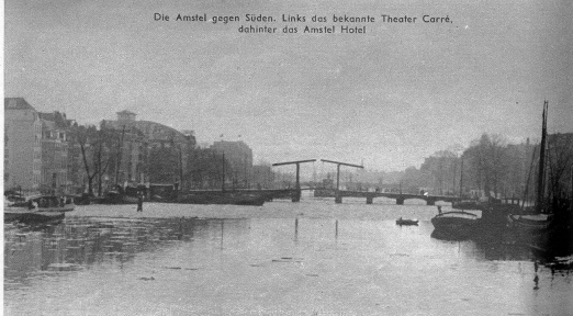
Die Amstel gegen Süden. Links das bekannte Theater Carré, dahinter das Amstel Hotel