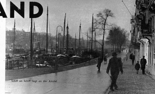
Schiff an Schiff liegt an der Amstel

Holland, das im allgemeinen nur bis 12 Meere über Meer und von dem grosse Teile unter dem Meeresspiegel liegen, hat ein demütigendes Klima, und ich bekam schon in den ersten Stunden einen Versuch von holländischen Nebel, der sich blitzschnell über das ganze Land zog. Nur gut, dass die Autobahn von Rotterdam nach Amsterdam ein Bahn auf zwei Bahnen ohne Gegenverkehr gestattet, denn bei diesem Nebel, der eine Sicht von kaum 10 Metern erlaubte, war das Spritzen keine reine Freude mehr. Feiner Niesel regnete auf den Brücken, die über die Strassen führen, kommen diese schönen Strassen zusammen - eine gefährliche Angelegenheit, die jeden Tag Unglücke herbeiführt. In Reich und Glied präsentiert sich Am-