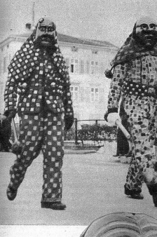
Eine der alten Gemeindemasken, die zum Stolz der Gemeinde Wallenstadt gehören und nur von Aus-erwählten getragen werden dürfen

Stitte «hoch» nimmt. Hier gehört das seit alters her zur eingetragenen Fast-nachtstradition, und die wird, wie nicht gerade etwas anderes, hoch in Ehren gehalten. Zu dieser Tradition gehö-ren aber vor allem die von den Kindern, oft sogar auch noch von den Erwachse-nen, gefürchteten «Röllis» im bunten Blättelkleid und mit grün-rot karierten Kopftüchern und Rollengurt angetan. Sie tragen festsitzende, kunstvoll ge-schnitzte Holzlarven, deren angele-bendende Grimassen phantasievoll aus-gesahlt sind. Die kostbaren alten Lar-ven sind Eigentum der Gemeinde, des-halb nennt man sie auch Sourszchand «Gemeindelarve». Diese Röllibutzen» er-füllen ursprünglich mehr sittenpoliti-sche Aufgaben. Mit einer Art Holzkeule oder seltener auch mit einer Schwedne-blase bewaffnet, jagen sie am Abend die Kinder nach Hause und vertrieben lichtscheues Gesindel. Ueberlieferungs-getro sind sie auch heute noch hinter den Büben her, von denen mancher von kilometerweiten Hetztreiben berichten kann. Aber alle Burachen sehen sich natürrlich darnach, selber einmal in der Aufmachung eines «Röllis» triumphi-erend zu können. Eine neuere Errechnung ist vielleicht der ulkige Fastnachtsumzug, den sich die Wallenstädter heute auch